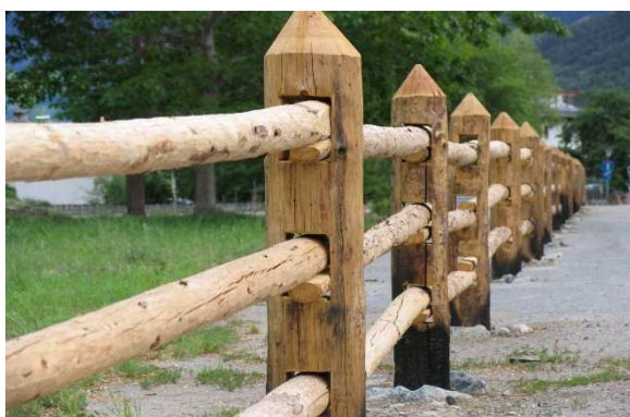
Immagine 12: "Sailzaun" con 3 stanghe