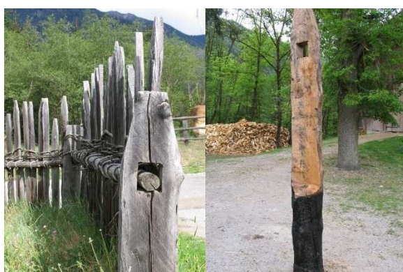
Immagine 15: "Speltenzaun" e colonna forata, carbonizzata