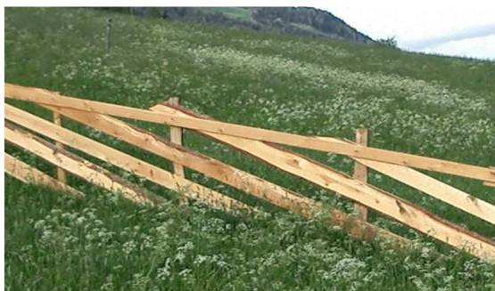
Immagine 1: con assi