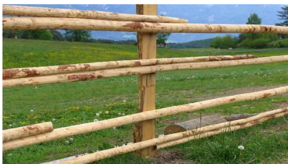
Immagine 9: le stanghe una appoggiata sopra all'altra