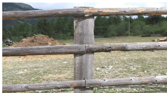
Immagine 10: le stanghe una affiancata all'altra