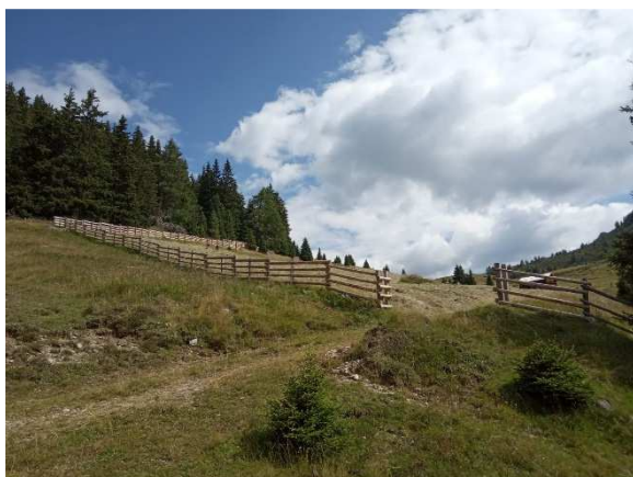
Immagine 8: esempio di un "Stangenzaun" inchiodato nell'Alta Val Pusteria

Se il diametro dei montanti lo permette, questi possono essere spaccati oppure segati a metà. Anche le stanghe/"Latten" nel caso in cui il diametro lo consenta possono essere dimezzate. Vengono posate o una appoggiata sopra all'altra (immagine 9) oppure inchiodate sul montante smussato (immagine 10).