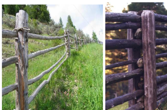
Immagine 6: lo "Stangenzaun" tipico per la Val Venosta