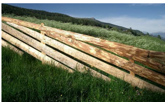
Immagine 2: con sciaveri