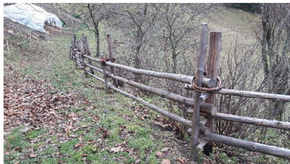
Immagine 4: Il tipico "Stangenzaun" con chiodi di legno e "Weideband"