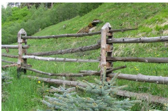
Immagine 11: "Sailzaun" con 4 stanghe

Il cosiddetto "Sailzaun" è fatto di grossi montanti in legno carbonizzati superficialmente, appuntiti e rotondi e di diametro idoneo, nei quali vengono praticati 3 - 4 fori a sezione quadrata. Attraverso tali fori vengono fatte passare orizzontalmente le stanghe/"Latten" rotonde (immagine 11 e 12).