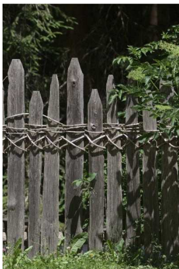
Immagine 13: "Speltenzaun" classico con legno spaccato e legatura incrociata