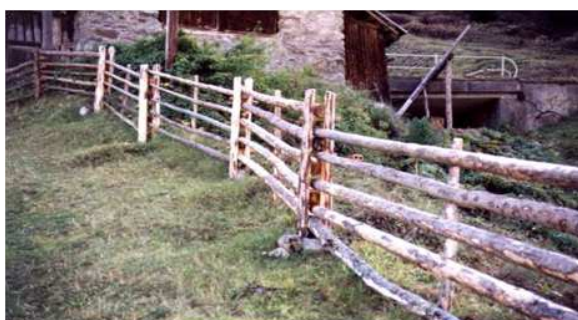
Immagine 7: lo "Stangenzaun" senza chiodi di legno o altri distanziatori tra le stanghe