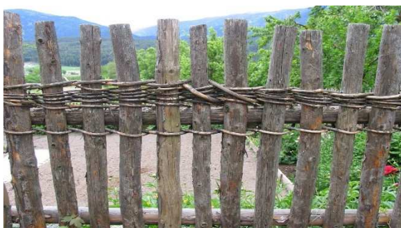
Immagine 14: "Speltenzaun" con legno tagliato e legatura semplice