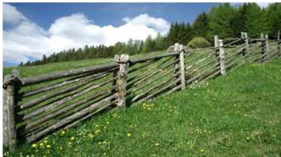
Immagine 3: tipico per la Val d'Ultimo – le stanghe posate in modo obliquo